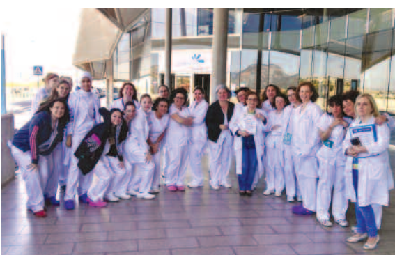
Hospital Santa Lucía, Murcia.