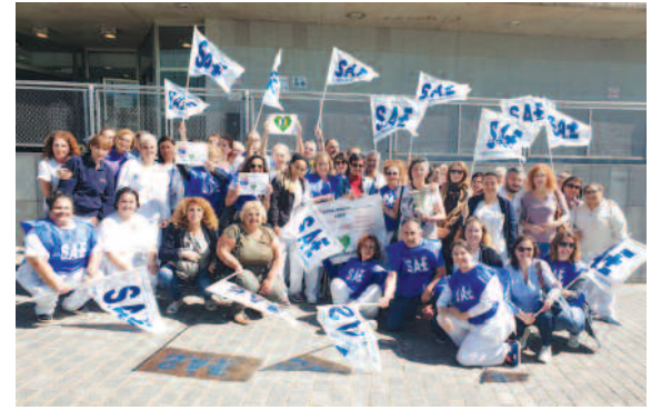
Hospital Universitario de Canarias.