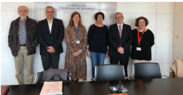
Los responsables de SAE junto al Consejero.