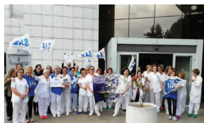
Hospital San Agustín de Avilés (Asturias).