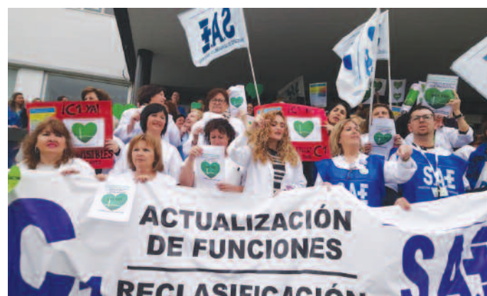
Hospital Virgen Macarena de Sevilla (Andalucía).