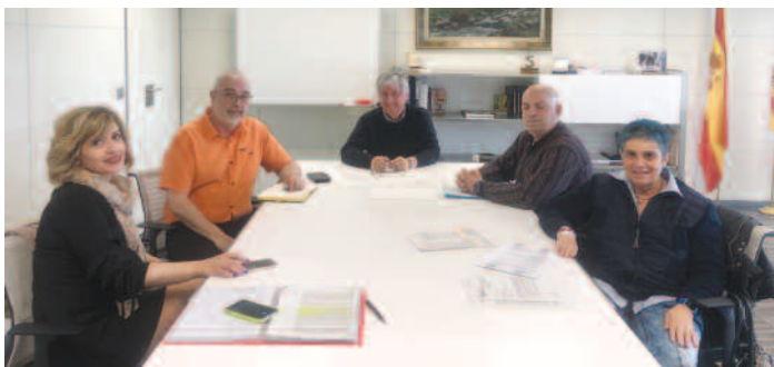
Reunión con el Gerente y el Director de RR.HH. del Salud.