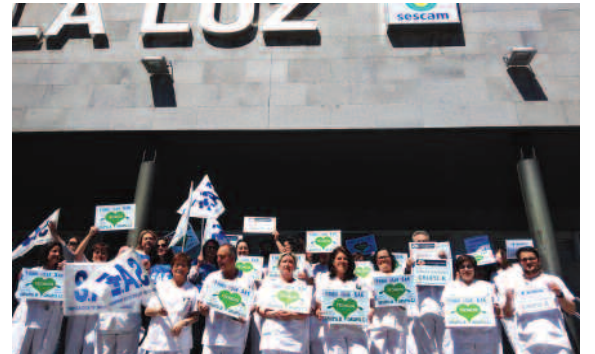
Hospital Virgen de la Luz de Cuenca (Castilla La Mancha).