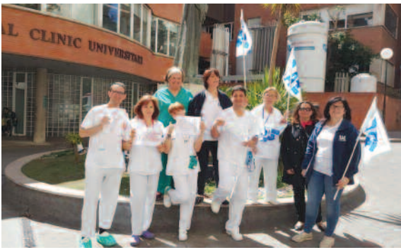
Hospital Clinic Universitari de Barcelona (Cataluña).