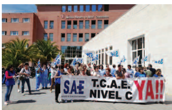
Complejo Hospitalario de Navarra.