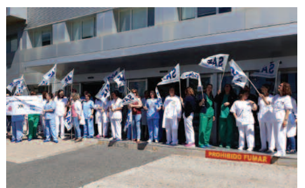
H. Ntra. Sra. de Sonsoles de Ávila (Castilla y León).