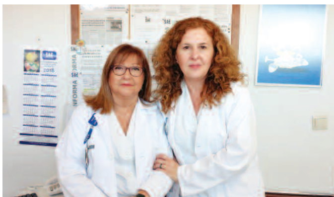
Delegadas de SAE en Elche.

SAE HA conseguido que una compañera Técnico en Cuidados de Enfermería se incorpore como adjunta del Supervisor del Servicio de Urgencias del Hospital General Universitario de Elche.