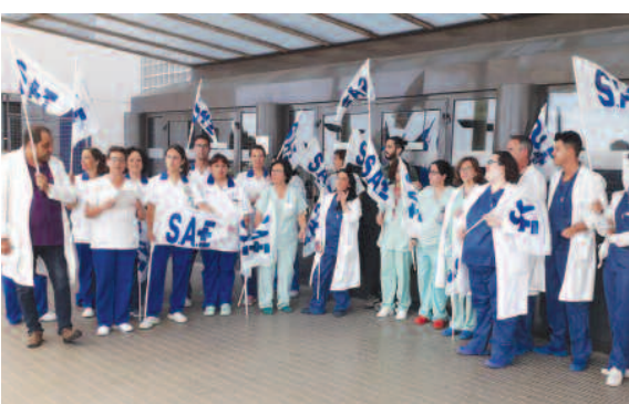
Hospital de Alzira en Valencia (Comunidad Valenciana).