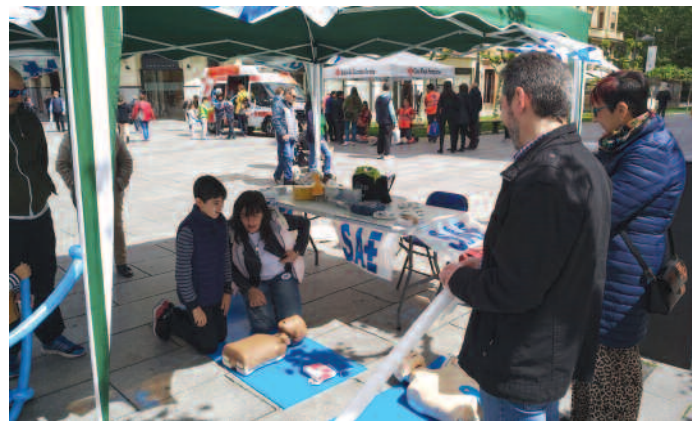
SAE ha organizado talleres para celebrar el Día de la Enfermería.

LOS PROFESIONALES navarros han celebrado el Día Internacional de la Enfermería, que se conmemora el 12 de mayo, con una jornada en la que la formación y el ocio han estado muy presentes.