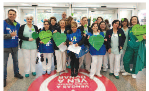
Hospital Gregorio Marañón, Madrid.