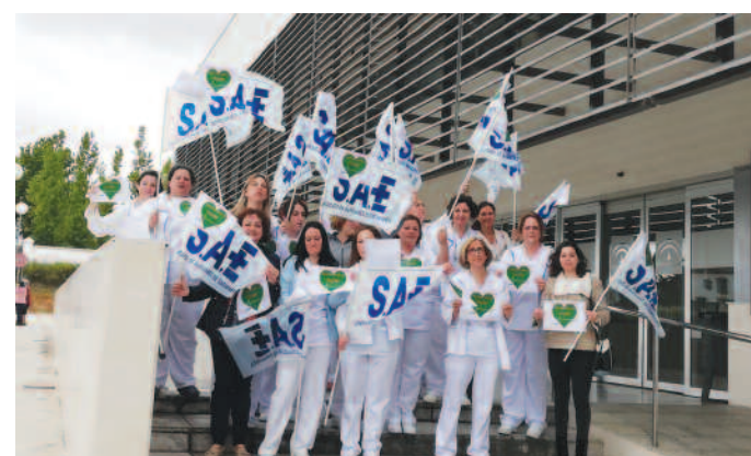
Hospital de Montilla de Córdoba (Andalucía).