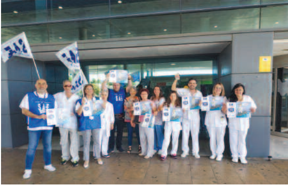
Hospital Son Espases (Baleares).