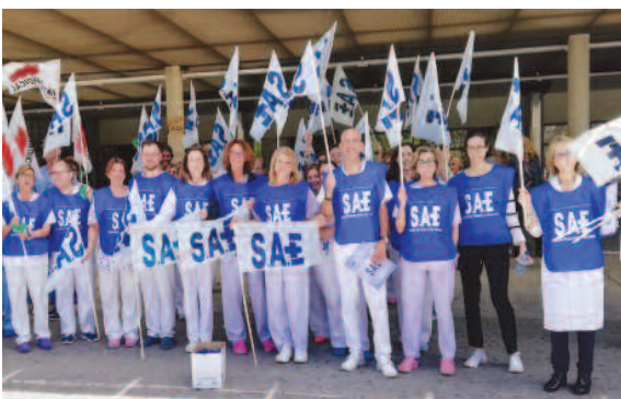
Hospital General Universitario de Alicante (Comunidad Valenciana).