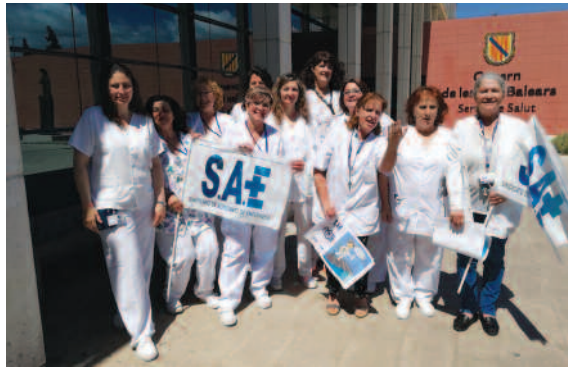
Hospital de Inca (Baleares).