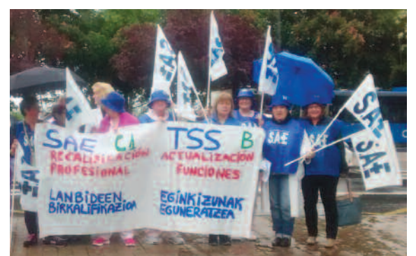
OSI Donostialdea de Guipúzcoa (País Vasco).