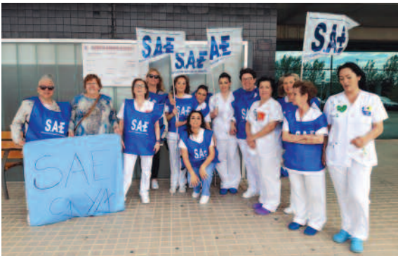
Hospital de Albacete (Castilla La Mancha).