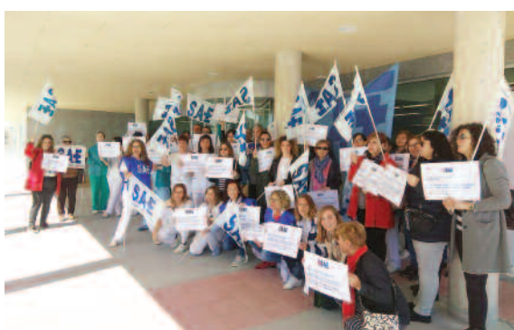
Hospital de Burela (Galicia).