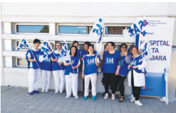
Hospital Santa Bárbara de Soria (Castilla y León)