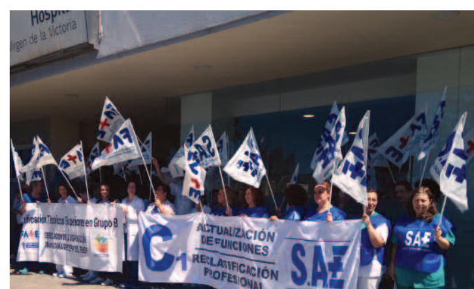
Hospital Virgen de la Victoria de Málaga (Andalucía).