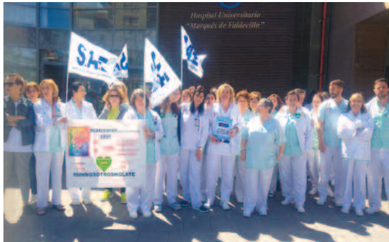
Hospital Marqués de Valdecilla (Cantabria).