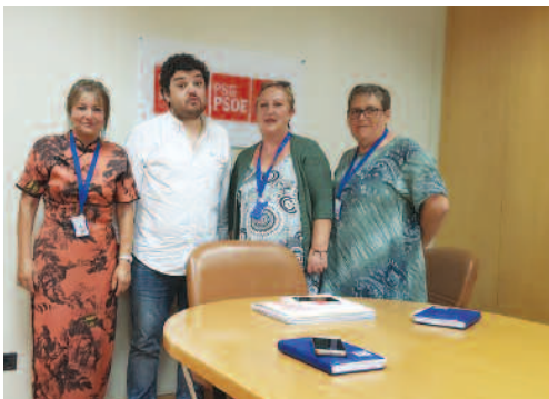
Responsables de SAE en Galicia.