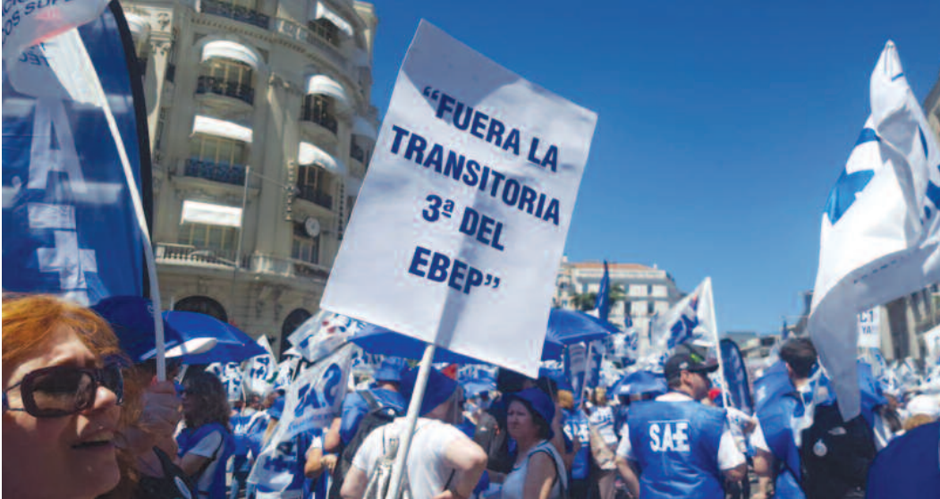
Un momento de la concentración que SAE convocó el pasado 18 de junio frente al Congreso de los Diputados pidiendo la finalización de la Disposición Transitoria Tercera del EBEP.

EL REAL Decreto-Ley 3/1987, de 11 de septiembre, por el que se aprobaba el nuevo régimen retributivo del personal del Instituto Nacional de la Salud disponía- art. 3, que no era otra cosa que una simple transposición del art. 25 de la Ley 30/1984, de 2 de agosto, de medidas para la Reforma de la Función Pública- cómo, a los efectos del percibo de las retribuciones básicas que se establecían en el mismo, la categoría de Auxiliar de Enfermería, para la que se exigía el Título de Formación Profesional de primer grado, rama sanitaria o equivalente, quedaba encuadrada o clasificada en el Grupo D.