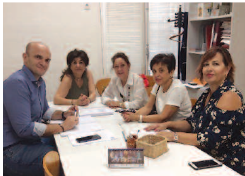
Responsables de SAE en Murcia.