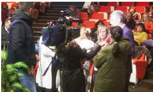
Un momento de las jornadas celebradas en Ávila.