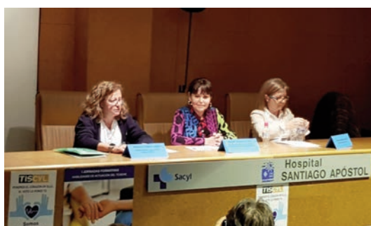
Un momento de las jornadas celebradas en Miranda de Ebro.