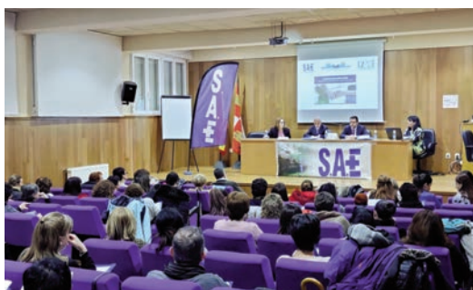
Un momento de las jornadas celebradas en Soria.