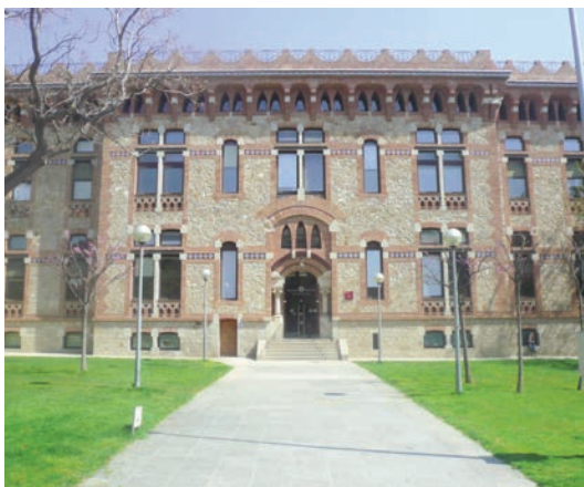
Departamento de Salud.