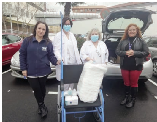
Los delegados de SAE en Valencia consiguen material de protección para los hospitales valencianos.

"Estos son solo algunos ejemplos de las condiciones de inseguridad en las que están trabajando los profesionales, por ello desde SAE hemos interpuesto esta denuncia con el objetivo de que se disponga la incoación de diligencias que permitan el esclarecimiento de los hechos denunciados y una vez se constate su realidad y su previsible dimensión penal, se plantee ante el órgano judicial competente. A esta denuncia hay que sumar las numerosas cartas al Ministro de Sanidad reivindicando la realización de la prueba al personal sanitario y una dotación suficiente de EPIS, cartas a las gerencias exigiendo mayores medidas de protección y un reparto equitativo del material, reuniones con diferentes responsables sanitarios para buscar las mejores actuaciones ante esta situación, participación en los medios de comunicación denunciando la precaria situación... Desde SAE, los delegados que aún no hemos sido llamados a reincorporarnos al servicio, continuaremos luchando para que se garantice la seguridad de todos los trabajadores. Finalmente, quiero transmitir todo mi ánimo y gratitud a todos nuestros compañeros que, desde hace más de un mes, se están dejando la piel por preservar nuestra salud", explica M. a Dolores Martínez.