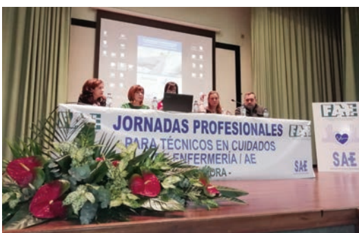
Un momento de las jornadas celebradas en Zamora.

EL SINDICATO de Técnicos de Enfermería y la Fundación para la Formación y Avance de la Enfermería han celebrado varias jornadas formativas en Castilla y León bajo el título "Habilidades de Actuación del TCAE".