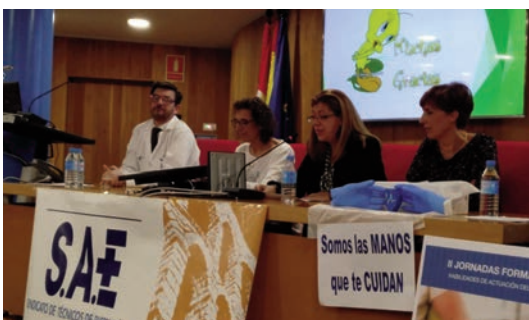
Un momento de las jornadas celebradas en Segovia.