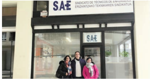
Los delegados de SAE del H. Sociosanitario de Cruz Roja de San Sebastián.

LOS COMICIOS celebrados en el Centro Sociosanitario Cruz Roja de San Sebastián, en el Hospital San Rafael de Madrid y en el Servicio de Salud de Castilla y León, han arrojado nuevos delegados para USAE.