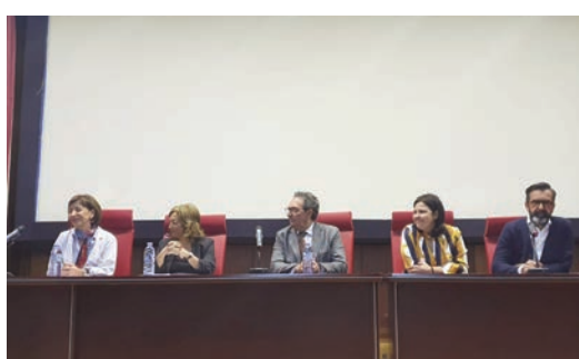
Un momento de las jornadas celebradas en León.