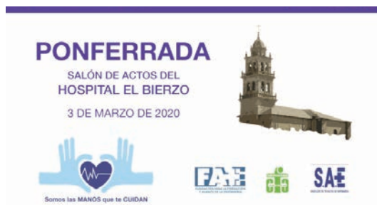
Los profesionales TCE de Ponferrada no pudieron asistir a sus jornadas ya que fueron suspendidas por el Hospital debido al coronavirus.