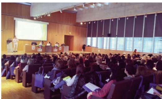
Un momento de las jornadas celebradas en Burgos.