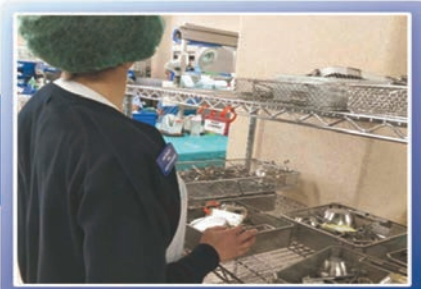
El trabajo profesional de los TCE en Esterilización evita las infecciones

Año Internacional del Equipo de Enfermería