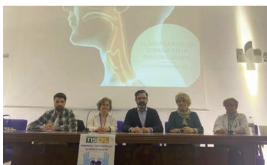
Un momento de las jornadas celebradas en Palencia.