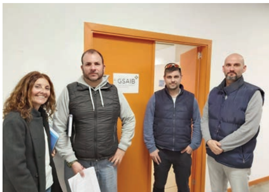
Los delegados de SAE tras la primera reunión.

LOS DELEGADOS de USAE están participando en las negociaciones para la redacción del convenio colectivo de la empresa pública GSAIB. Durante las primeras reuniones se han planteado los temas fundamentales que debe recoger el