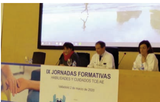
Un momento de las jornadas celebradas en Valladolid.