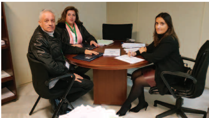
Los responsables de SAE se reúnen con el PP.

LOS RESPONSABLES de SAE en Andalucía se han reunido con los miembros del Partido Popular con el objetivo de trasladarles las principales reivindicaciones de los profesionales técnicos sanitarios andaluces.