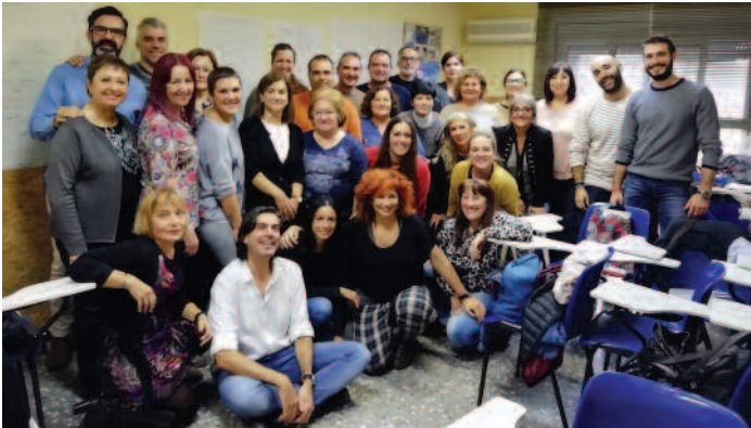
Curso de Prevención en Barcelona.