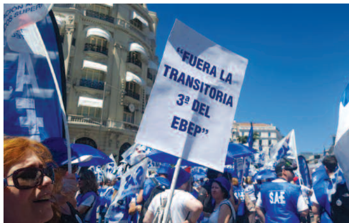
Concentración el 18 de junio de 2019 en el Congreso.