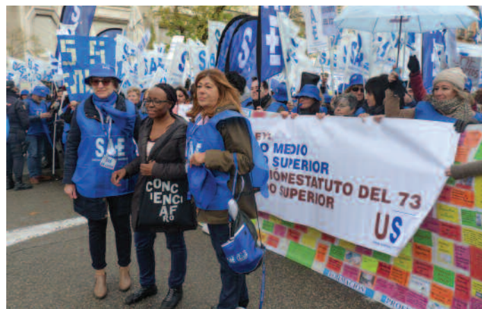
Concentración el 13 de diciembre de 2018 en el Congreso.