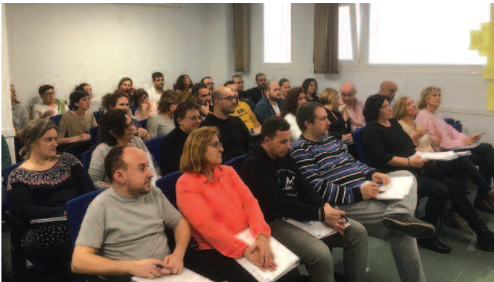
Un momento del curso en Baleares.