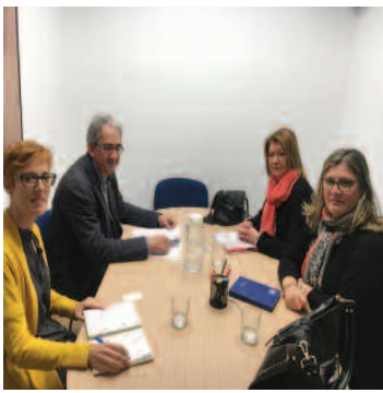
Reunión con U. Podemos.