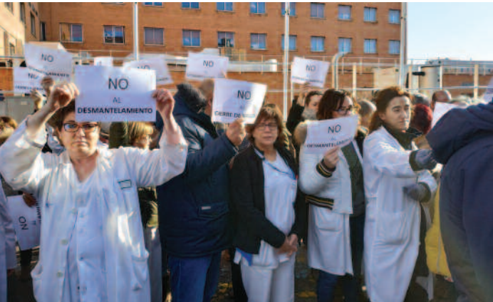
Los trabajadores se concentraron contra la medida.

LOS REAJUSTES sanitarios que deban llevarse a cabo han de hacerse con la debida transparencia y cuando estos afectan a los trabajadores con información puntual de cómo les influirán estos procesos en su trabajo diario. Sin embargo, los profesionales de la UCI de pediatría del Hospital Clínico de Valladolid no han recibido información de cómo les afectará el cierre de esta unidad tras la decisión del Servicio de Salud de Castilla y León de centralizar la atención pediátrica en el Hospital Río Hortega. “Los trabajadores y los sindicatos que somos sus representantes no hemos recibido ninguna información al respecto”, ha mani-