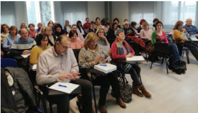
Curso de Prevención en Aragón.

EL SINDICATO de Técnicos de Enfermería ha impartido varios cursos de Prevención de Riesgos Laborales entre los delegados de la Organización con el objetivo de formarles y corregir así todos aquellos aspectos que puede desembocar en incidentes y/o accidentes laborales.