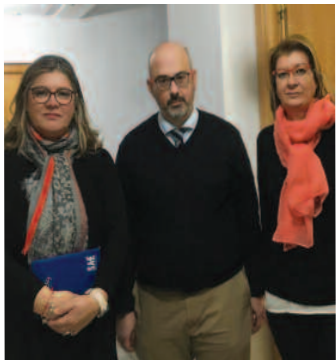
Reunión con Ciudadanos.