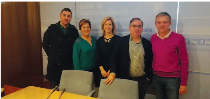
Los responsables de SAE con los miembros del PSOE.

LOS RESPONSABLES de SAE han mantenido una reunión con los representantes del Grupo Parlamentario Socialista en las Cortes de Castilla-La Mancha en la que además de plantearle las principales reivindicaciones de los TCE -actualización de competencias, finalización de la Disposición Transitoria Tercera del EBEP y reconocimiento del grado Superior de la Formación Profesional, le han entregado un ejemplar del Libro Blanco en el que se recogen diferentes