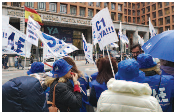
Concentración de 30 de noviembre de 2019 frente al Ministerio.