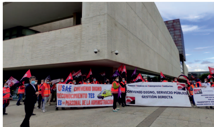
Los trabajadores del transporte sanitario participaron recientemente en la manifestación convocada por USAE en Valladolid.

LOS TRABAJADORES del transporte sanitario reclaman una mejora de sus condiciones económicas y laborales ante una situación "límite" que afecta a cerca de 1.800 trabajadores en Castilla y León. El convenio colectivo está paralizado desde hace más de dos años, lo que mantiene a los trabajadores estancados en la misma situación desde hace más de diez años.