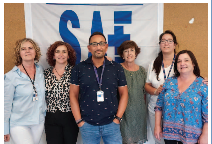
Comisión Ejecutiva Provincial.

LOS AFILIADOS al Sindicato de Técnicos de Enfermería han celebrado recientemente su VII Congreso Provincial para, entre otros puntos del orden del día, elegir a la Comisión Ejecutiva Provincial que llevará a cabo la representación de los afiliados, en primer lugar, y de los TCE en general, alaveses.