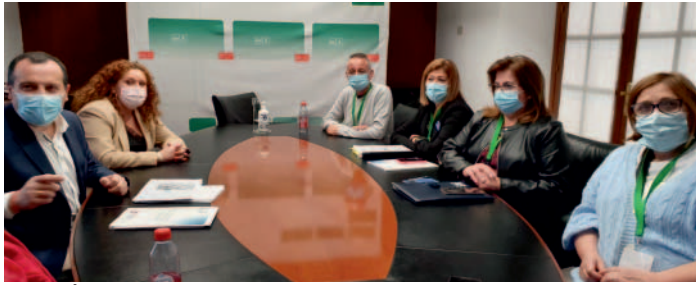
Reunión con el grupo parlamentario PSOE.

CASI UN millar de TCE se concentraron frente al Parlamento para mostrar, una vez más, el malestar y descontento que vienen sufriendo desde hace décadas. Pero, "sobre todo, para demostrar que somos un colectivo muy grande y fundamental