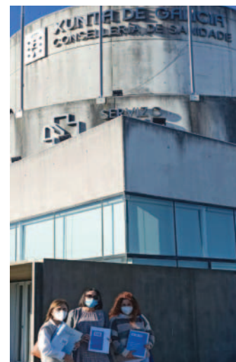
SAE presentó sus alegaciones.

Otros sindicatos apoyan el plan de A.P. sin tener en cuenta ni la incorporación del TCE ni el aumento de profesionales de esta categoría. Confiamos, no obstante, en que la nueva regulación de la Atención Primaria en Galicia tenga en cuenta el papel fundamental e indispensable que tienen