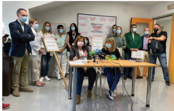
Un momento de la rueda de prensa que convocó la Junta de Personal, de la que forma parte SAE.

SAE, Y el resto de miembros de la Junta de Personal del Área I del SCS (H.U. Marqués de Valdecilla y Atención Primaria de Santander), ha exigido a la Consejería de Sanidad y al SCS, la finalización de los recortes en recursos humanos y el ajuste de los presupuestos de 2022 a la realidad asistencial, que precisa de un aumento de plantillas.