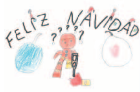
Izan Faus Pinel 8 años (Valencia).