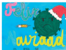
Vega Ramos Picazo 13 años (Guadalajara).