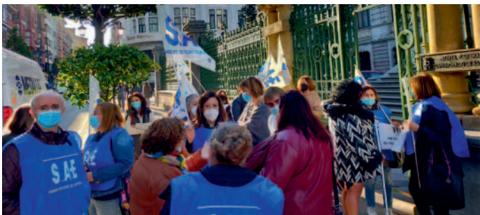
Un momento de la concentración.