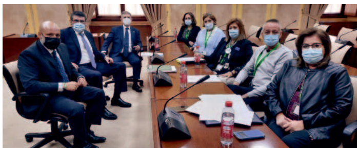
Reunión con el grupo parlamentario Vox.