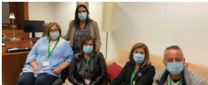
Reunión con el grupo parlamentario Partido Popular.