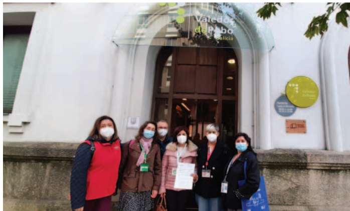
Presentación del documento a la Valedora del Pueblo Gallego.