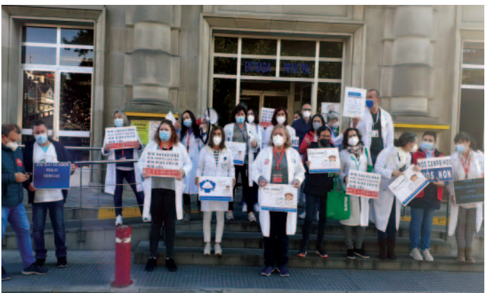
Concentración en La Coruña.