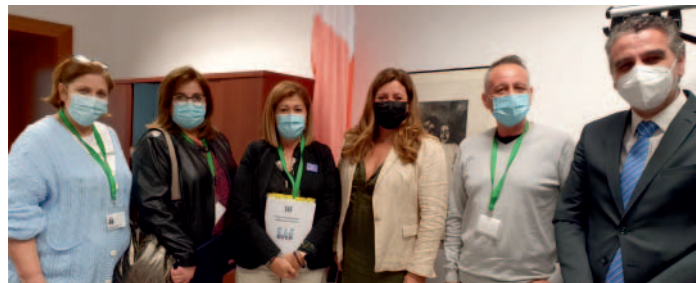
Reunión con el grupo parlamentario Ciudadanos.