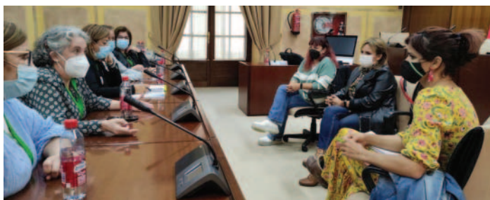
Reunión con el grupo parlamentario Adelante Andalucía.