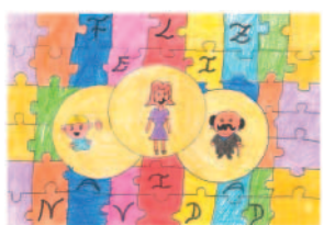
Lucía Faus Pinel 10 años (Valencia).