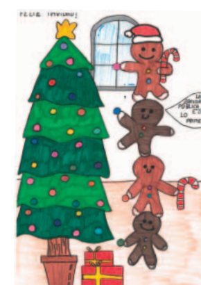
Abril Ramos Picazo 10 años (Guadalajara).