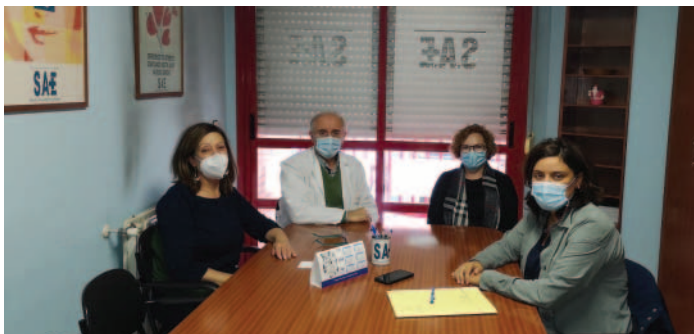
Reunión de los responsables de SAE con la Diputada del PP.