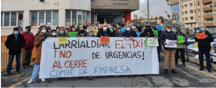
SAE se concentra por el cierre de las Urgencias.