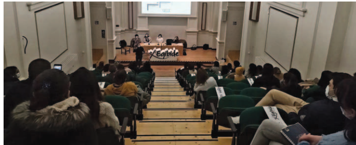
Presentación de SAE y FAE a alumnos de FP.