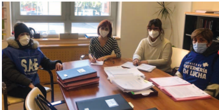
Reunión con la Directora General de Profesionales de la Junta.