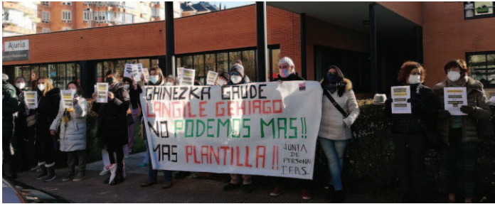
Concentración por el aumento de plantilla en el IFBS.