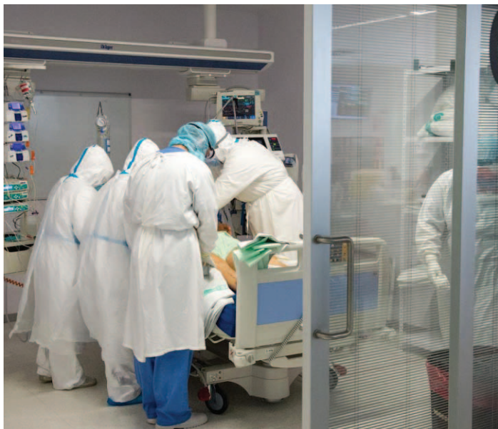
Cada profesional sanitario debe responsabilizarse de la limpieza de su EPI.

SAE VUELVE a ganar una sentencia que reconoce que las órdenes impartidas a los Técnicos en Cuidados de Enfermería para la limpieza de los Equipos de Protección Individual (EPI) son ilegales. En esta ocasión ha sido el Tribunal Superior de Justicia de Andalucía que, además, en el fallo de la sentencia ordenó al Sistema Andaluz de Salud que pusiera fin, de inmediato, a estas órdenes.