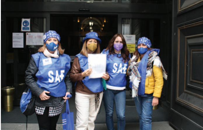
Entrega de 60.000 firmas de profesionales Técnicos en el Ministerio de Sanidad y en el de Hacienda y Función Pública.