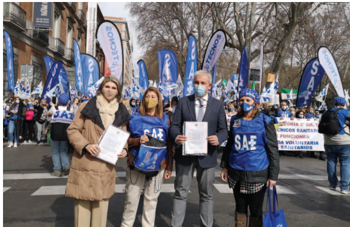
Los portavoces del Partido Popular de Función Pública y Sanidad se sumaron a la manifestación.

Ni las responsables ministeriales ni el resto de partidos políticos, también convocados, han acudido a la cita, demostrando su nulo interés por nuestros derechos. Hemos solicitado reuniones con todos ellos que, esperamos, se materialicen y finalice este juego que se traen entre unos y otros trasladándose la toma de decisiones y eternizando su puesta en marcha. Aceptar un cargo político supone cumplir con las responsabilidades asociadas y, desde luego, es prioritario velar por los derechos de los sanitarios y, por lo tanto, de los ciudadanos.