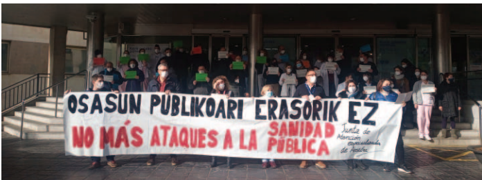
Concentración en Txagorritxu.